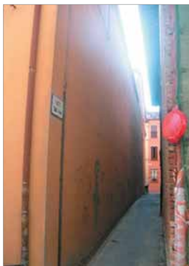
Vicolo Sant'Anna Fronte Laterale