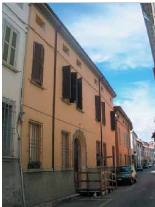
Via Oberdan 40 Fronte Principale